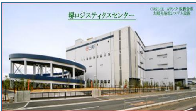
堺ロジスティクスセンター

税関と関連民間業界(船会社、船舶代理店、CYオペレーター、保税業者、通関業者、及び輸出入業者)をオンラインで結び、異業種にわたる利用者の各種業務を処理する“官民共同利用システム”として運用されている。